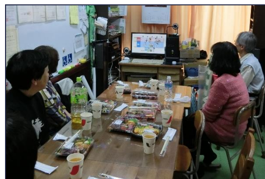
録画した認知症の番組を見て意見交換